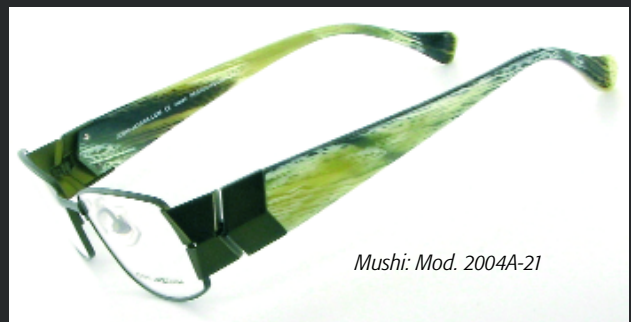
Mushi: Mod. 2004A-21