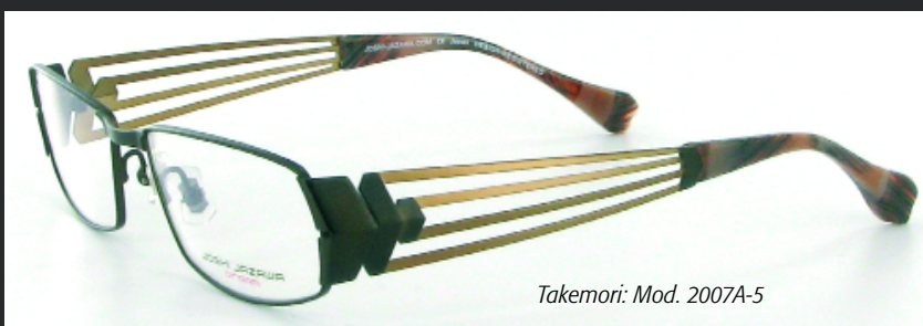
Takemori: Mod. 2007A-5