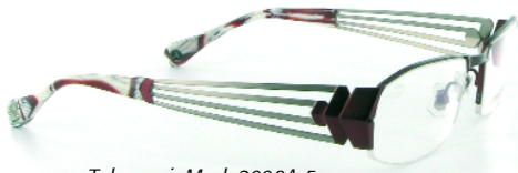
Takemori: Mod. 2008A-5

Neu bei der Exklusivbrillen- agentur Emmerich: Die japa- nische Faltechnik Origami war die Grundlage für das Design der Bügel und ist der Leitfaden der neuen Brillenkollektion von Designer Joshi Jazawa