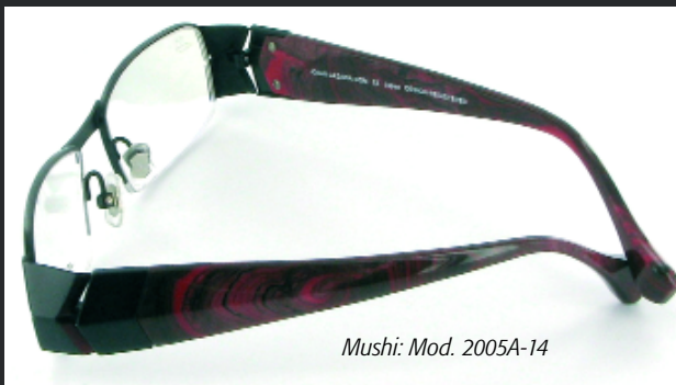
Mushi: Mod. 2005A-14

Origami kann man in jedem Alter lernen. Es erfordert jedoch Geduld und Disziplin, die Eckpfeiler der japanischen Kultur. Infos finden Sie zum Beispiel unter www.origami-kunst.de oder unter www.papierfalten.de .