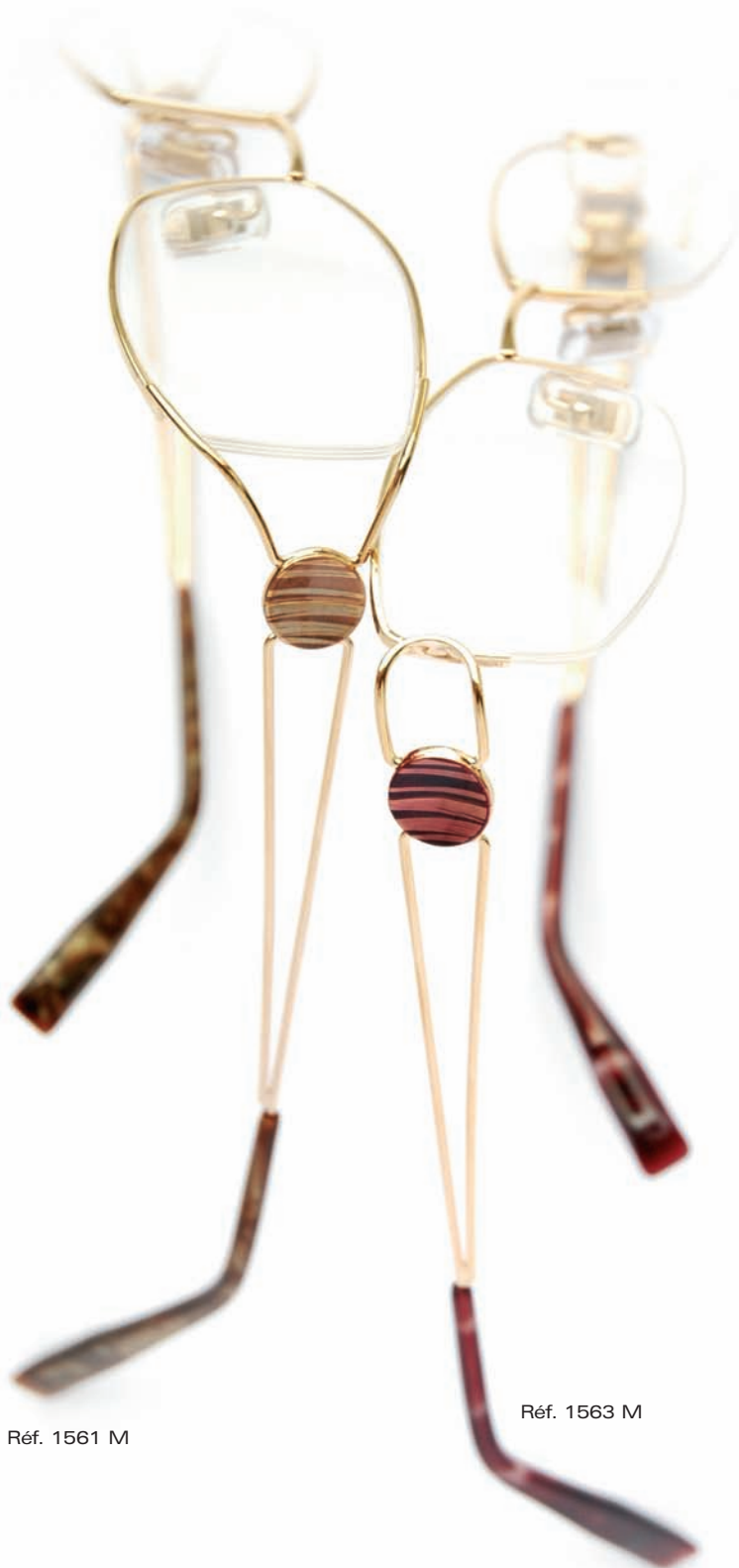
Réf. 1561 M