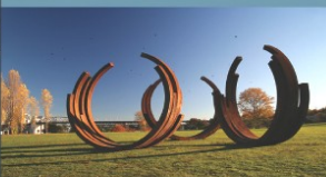
Bernar VENET - 229.5 Art x 5

Bernar VENET est un artiste français qui vit et travaille aux Etats-Unis. Peintre, photographe mais surtout sculpteur, ses œuvres intriguent et éblouissent volontiers le spectateur. Ses sculptures d'acier rouillé qui peuvent peser une dizaine de tonnes dégageent une grande énergie. Je me sens très proche de ces créations qui partent d'un raisonnement mathématique, rigoureux pour aller vers une représentation créative et rempli de poésie. Bernar VENET expérimente toujours et il est sans aucun doute l'un des plus grands représentants de « l'art conceptuel » à travers le monde. www.bernarvenet.com