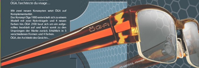
OGA 1900 - 6358 O