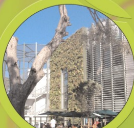
Mur végétal - Mauer aus Pflanzen

Zu allen Zeiten hat der Mensch die Grenzen der Natur überschreiten wollen. Heutzutage macht die Natur ihre Fackte wieder geltend. Mauern aus Pflanzen blühen an unseren Fassaden und auf unseren Dächern. Auf Anregung von Agri-Ingenieuren und Architekten entstehen die Wohnungen an Duftpalästen die jeweils mit den Jahreszeiten wechseln. Der Effekt ist beeindruckend und von großer Schönheit. www.greenwall.fr