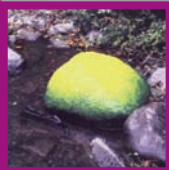
Andy Goldsworthy Art

Plasticien anglais devenu le chef de file du courant artistique que l'on appelle le Land Art, Andy Goldsworthy réalise des œuvres d'art éphémères qui ne vivent que quelques jours ou quelques heures uniquement à base de matériaux naturels (bois, feuilles, pierres ...). Réalisées dans un musée « à ciel ouvert », Andy Goldsworthy prend soin de photographier ses œuvres pour réaliser des ouvrages de grande qualité. Une démarche artistique mêlée à un engagement écologique fort.