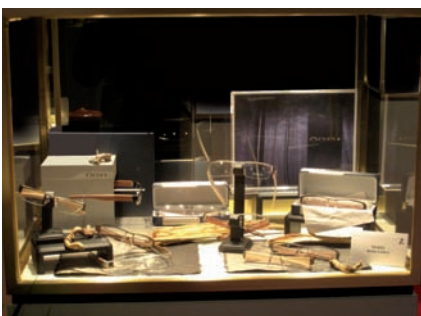
Vitrine Oga +Vision Expo West

Die Kollektion ÖGA+ wurde in den Vereinigten Staaten anlässlich der Expo West in Las Vegas vorgestellt. Der mehr als freundliche Empfang lässt auf eine erfolgreiche Zukunft hoffen.