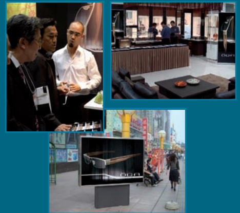
Lancement à Dalian (Chine du Nord)