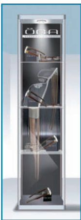
Stèle Oga +

Vorort wurde eine erhebliche Marketingorganisation aufgestellt. Die thematisierten Vitrinen sind äußerst erfolgreich.